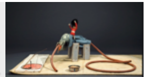
Calder ses animaux en fil de fer